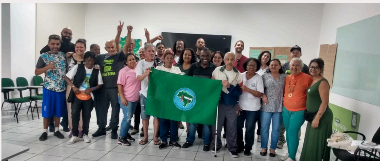
Turma 3/2024 da UNICATA, em São Paulo

Nesta edição você descobrirá o que é a UNICATA e como a educação pode transformar vidas (pg. 2). Você também verá os tipos de transporte utilizados na catação e o cotidiano de trabalho (pg. 5). Irá compreender a invisibilidade e a luta por reconhecimento das catadoras e catadores (pg. 9) e saberá mais sobre quem banca a reciclagem no Brasil (pg. 10). Na sequência, você entenderá sobre a importância e os desafios da educação ambiental (pg. 12).