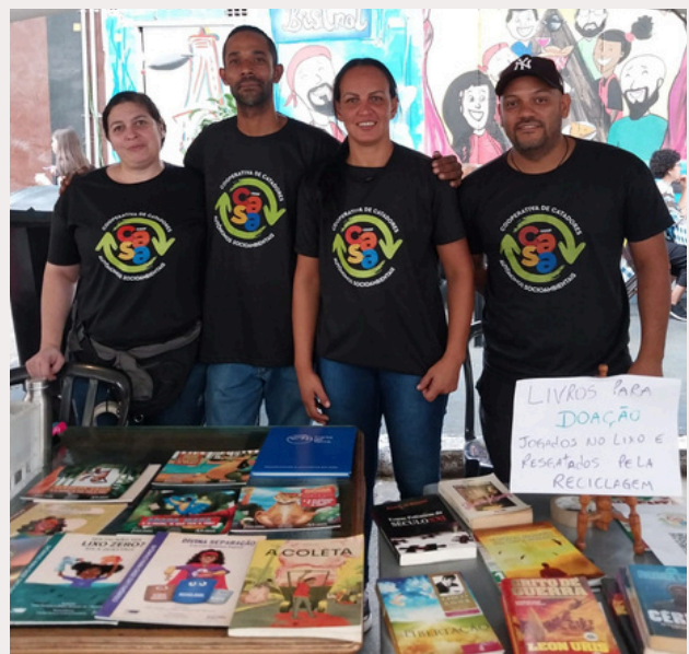
Ação da Coopcasa na Feira do Livro no Bixiga.

“A CoopCasa amplia nosso conhecimento em relação aos resíduos, mais do que isso, nos colocam próximos da realidade dos catadores, transformando o olhar, educando todo o MOVIMENTO com informações que somente quem vive pode proporcionar. Percebemos que com a presença da cooperativa no bairro, muitas pessoas começaram a olhar para seus resíduos de forma diferente e criamos juntos a valorização do profissional catador, ampliando seu significado”.