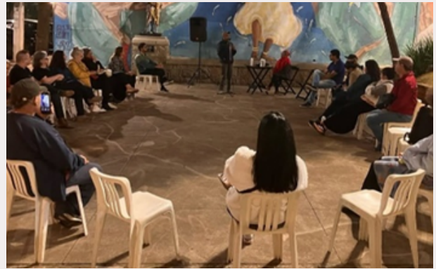
Primeira reunião do coletivo na Praça Dom Orione, Bela Vista/SP.

“Sozinho a gente até chega, mas com o grupo, a gente chega mais rápido e com mais força!” (Dona Cida).