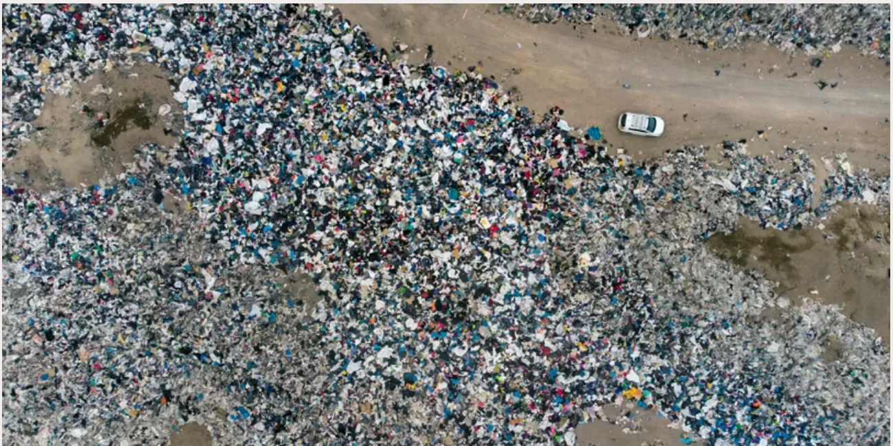
Descaso com tecidos têxteis no Deserto do Atacama, que se torna o deserto dos tecidos.

Imagine um deserto. Não um deserto de areia e cactos, mas um mar de roupas e tecidos que se estende até onde a vista alcança. Essa é a chocante realidade do Deserto do Atacama, no Chile, que se tornou um símbolo global do descaso com os resíduos têxteis. Essa imagem impactante, é apenas a ponta do iceberg de um problema que atinge o mundo todo. O consumo desenfreado, a "moda rápida" (fast fashion) e a falta de um destino correto para as roupas depois do uso estão transformando rios, mares e vastos territórios em depósitos de lixo têxtil.