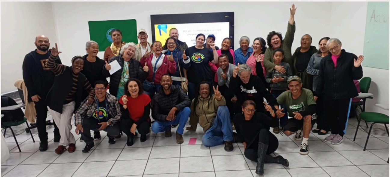
Turma 4/2025 da UNICATA, em São Paulo

Nesta edição você descobrirá como foi a 1ª Conferência de Educação Popular promovida pela UNICATA (pg. 2). Você também verá como funciona o processo da reciclagem e a importância da reutilização dos resíduos (pg. 4). Irá compreender o Lado B da Moda e aprender como os resíduos têxteis se tornaram um problema (pg. 6) e saberá mais sobre ações promovidas pelos catadores na educação e ação na Gestão dos Resíduos (pg. 08).