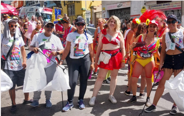
Ação da Coopcasa durante o Carnaval no Bixiga..