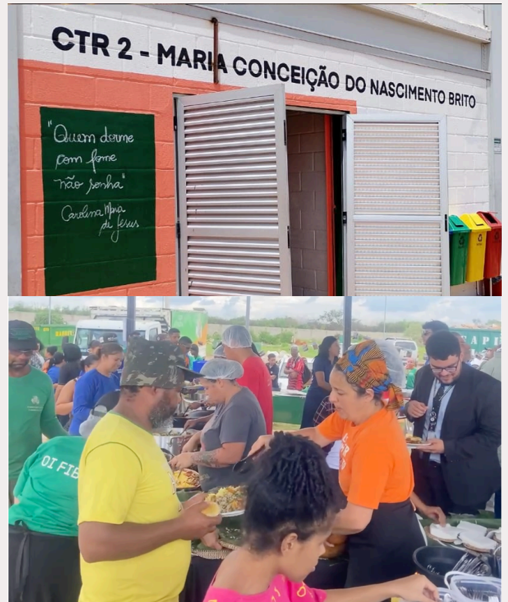
Inauguração da cozinha comunitária Diogo Sant'Ana em dezembro de 2024.

Vendo essas discussões e parcerias se formando, e os resultados como por exemplo a capacitação para os cooperados, que ampliam as oportunidades de desenvolvimento pessoal e profissional para todos os envolvidos