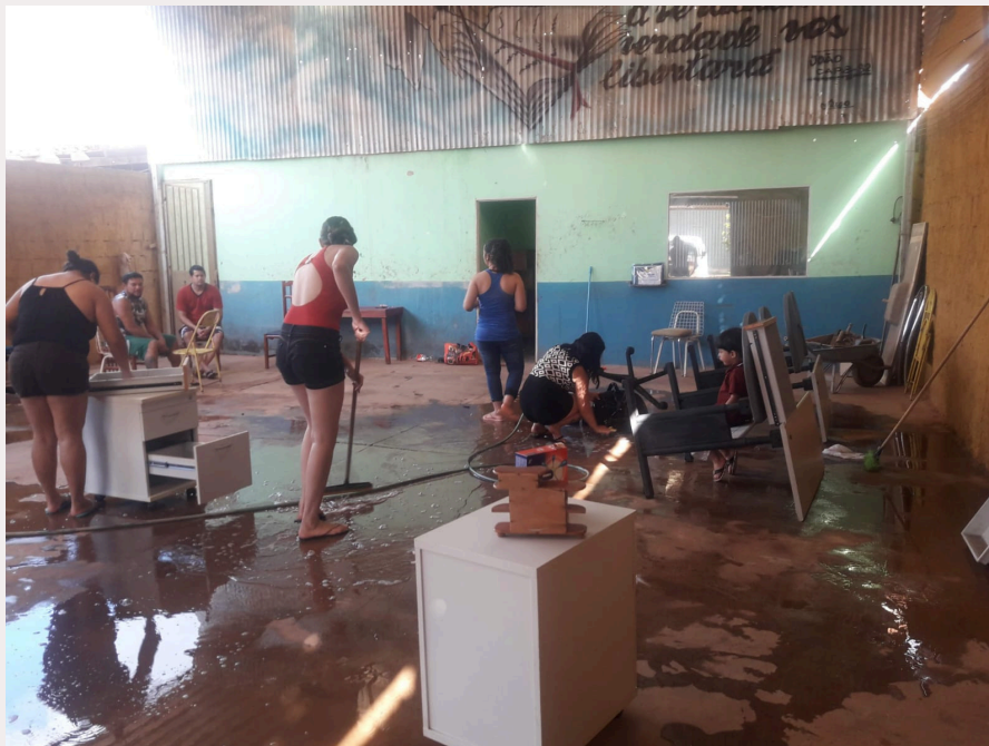
Primeiro galpão de trabalho da CETELS.

Dessa luta nasceu a CETELS, a cooperativa que ajudei a montar. Ela veio de um lugar de muito sofrimento, porque nós não tínhamos nenhuma infraestrutura. Conseguimos um pequeno espaço dentro da Central e hoje temos um contrato de coleta seletiva com o SLU.