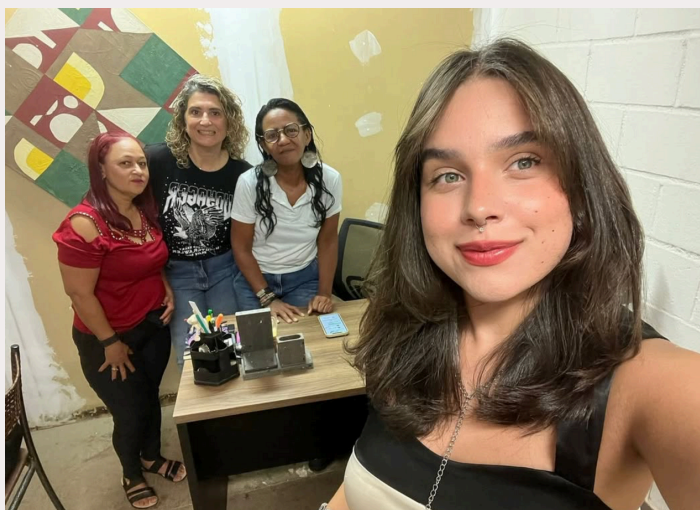
Diretoria da Cooperativa Nova Superação nas dependências do Complexo de Reciclagem.