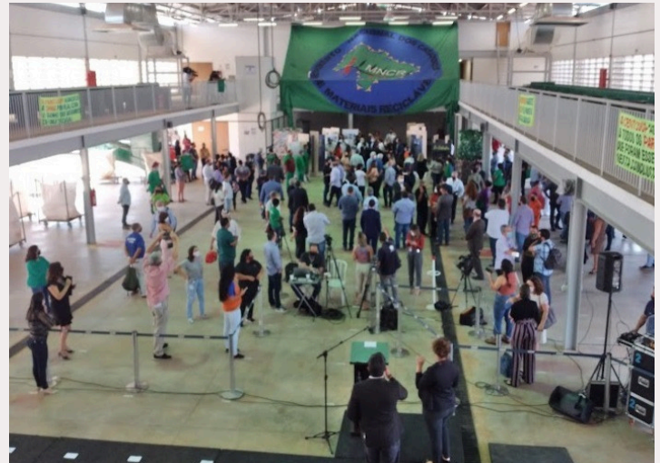
Inauguração do Complexo de Reciclagem em 2021.

Projetos de coleta seletiva, de triagem, com a participação de algumas cooperativas, e a exclusão de outras e, infelizmente, começou a separação de vários grupos: as cooperativas que atuavam dentro ou fora do lixão.