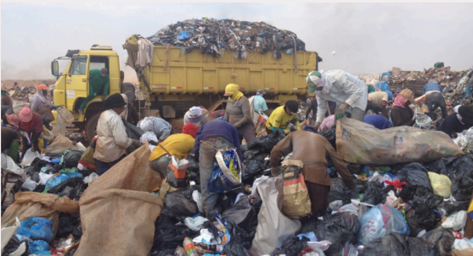
Lixão da Estrutural em atividade em 2017.

Em resposta a essa necessidade, o GDF lançou a proposta de criar um espaço mais seguro e adequado para os catadores: o Complexo Integrado de Reciclagem, localizado no SIA (Setor de Indústrias e Abastecimento). A proposta inicial era que as cooperativas de catadores, que antes atuavam no lixão, se mudassem para esse novo galpão, onde teriam melhores condições de trabalho.