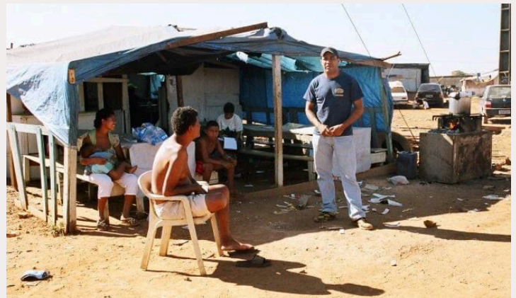
Ocupação da Reciclo em Taguatinga, DF. Aqui foi criada a Reciclo.

O barraco era a nossa cozinha comunitária. Aqui todos almoçavam, até moradores que não eram da cooperativa participavam da cozinha da Reciclo.