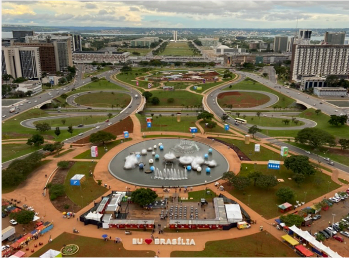
Capital Federal: uma ilusão? Foto panorâmica de Brasília.

Quando se fala em Brasília, geralmente pensamos em lugares bonitos, prédios altos, pessoas bem-vestidas. Eu não esperava encontrar uma realidade de tanta carência. Com o tempo, fui compreendendo melhor aquela situação. Depois de alguns anos, o lixão foi desativado e surgiram as cooperativas de catadores. O espaço da CENTCOOP foi entregue e, nesse meio tempo, vivi outras experiências de trabalho e conheci outras realidades. Até então, eu nunca tinha tido contato direto com uma cooperativa de catadores, embora tivesse amigos e familiares que já trabalhavam em cooperativas.