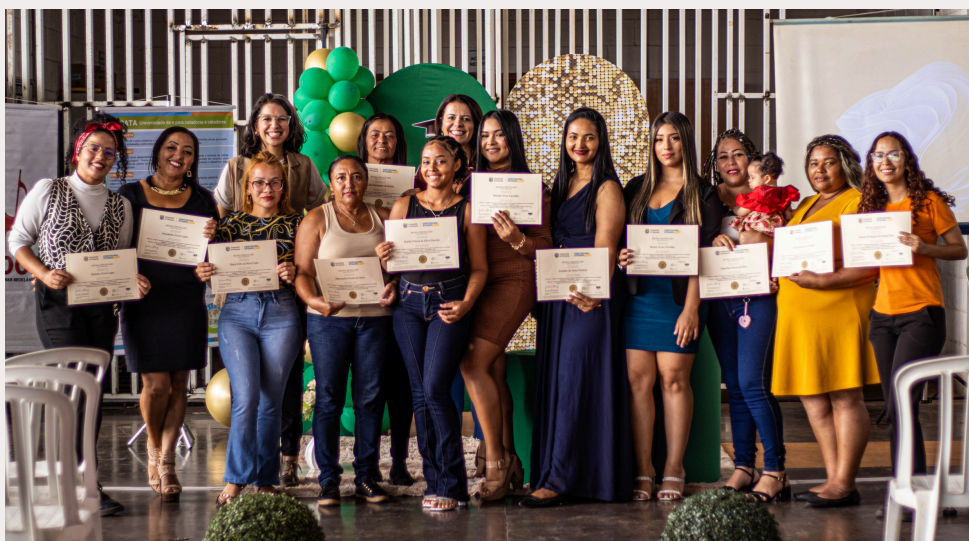
Módulo 1 - Turma Centcoop , Brasília DF, 2024

Seja bem-vindo à nova edição do Jornal da Unicata, a Universidade de e Para Catadores!