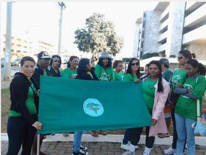
Cooperados da Reciclo em evento em Brasília em 2020.