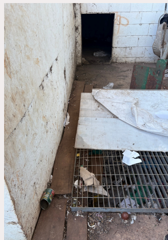
Caixa de manutenção da esteira com bueiros abertos no local e com lixo acumulado pela queda dos materiais