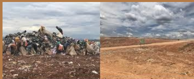
(Antes e depois do Lixão da Estrutural)

A celebração dos 21 anos ocorre em um momento de transição para a região. O fechamento do lixão em 2018 abriu um novo capítulo, desafiando a comunidade a se reinventar economicamente, enquanto carrega o legado e as marcas de ter crescido em volta da maior montanha de lixo do país.