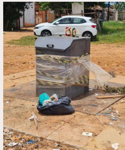
Papa-lixo 3: O papa lixo se encontra danificado ou mal instalado.