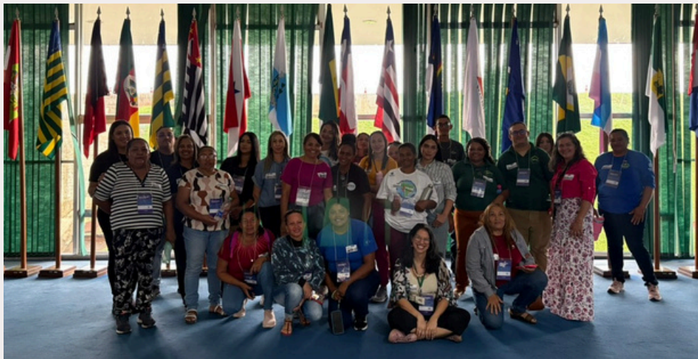
Módulo 3 - Turma Centcoop , Brasília DF, 2025

Seja bem-vindo à nova edição do Jornal da Unicata, a Universidade de e Para Catadores!