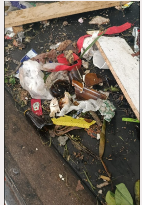
podas de árvore, entulho e outros materiais que não podem ser reciclados