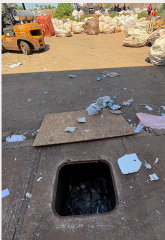
Bueiros da cooperativa sem tampa localizados em pontos de passagem dos trabalhadores

Não é preciso procurar muito para encontrar partes da estrutura que estão danificadas, entre elas, bueiros destampados - alguns deles com até 6m de profundidade -, tomadas deterioradas, buracos no forro do teto, janelas quebradas, entre outros sinais de má conservação do prédio, colocando em risco os trabalhadores e outras pessoas que ali frequentam.