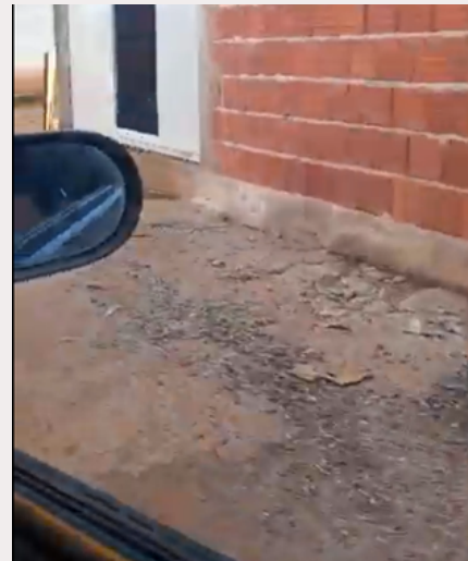
Papa-lixo 6 -Local destinado ao papa-lixo