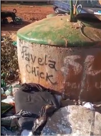
Papa-lixo 4: Muito lixo e entulho em volta. Ele também estava cheio de lixo