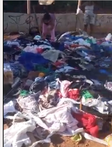
Papa-lixo 8: Roupas jogadas fora, além da presença de muito entulho.