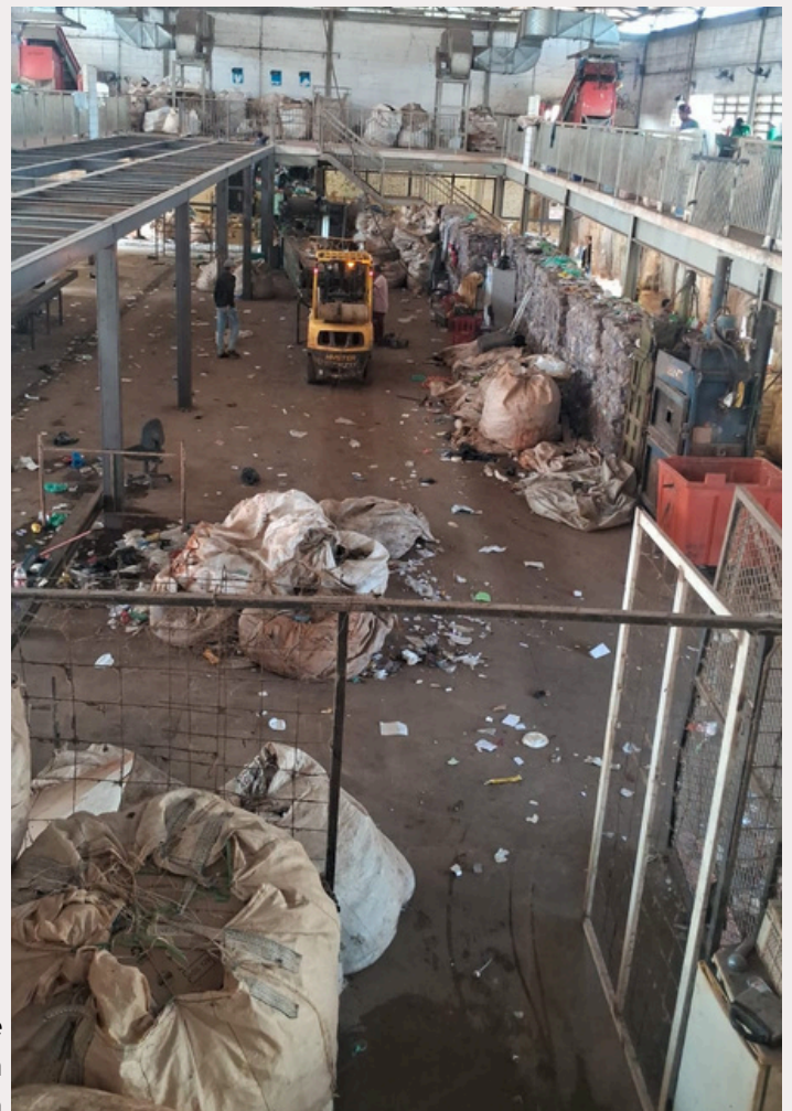
Espaço onde os resíduos são triados. Pode-se notar o acúmulo de material de maneira desorganizada

Apesar de ser uma atividade extremamente importante, as dificuldades relacionadas ao ofício do catador estão extremamente presentes na realização da sua atividade, algumas delas foram expostas por nossa reportagem.