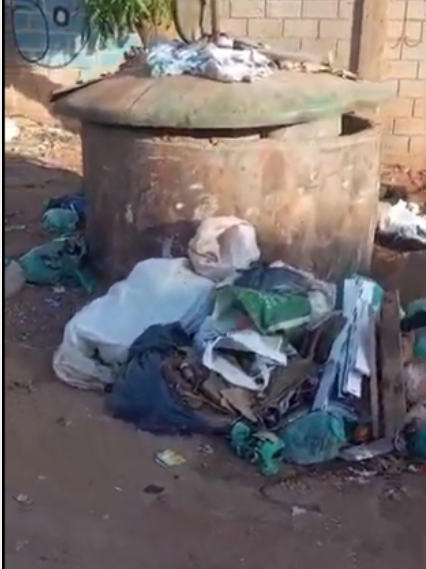
Papa-lixo 2 : Muito lixo fora do papa-lixo, vidro, resto de materiais de construção e sucata