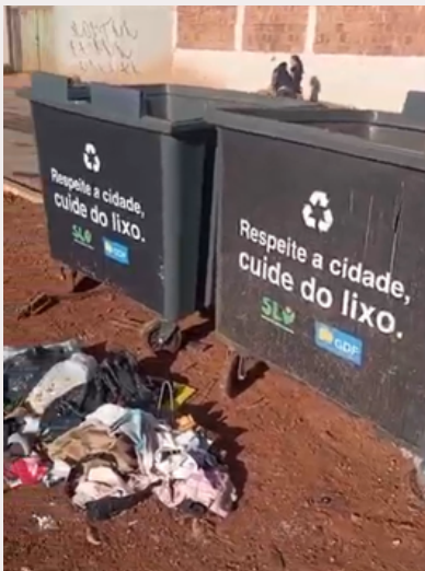
Papa-lixo 5- No lugar onde era para estar o papa-lixo foram colocadas duas caçambas, com espaço insuficiente para comportar o lixo.