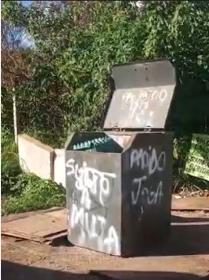
Papa-lixo 7: Papa-lixo recém instalado para substituir o que havia sido queimado.