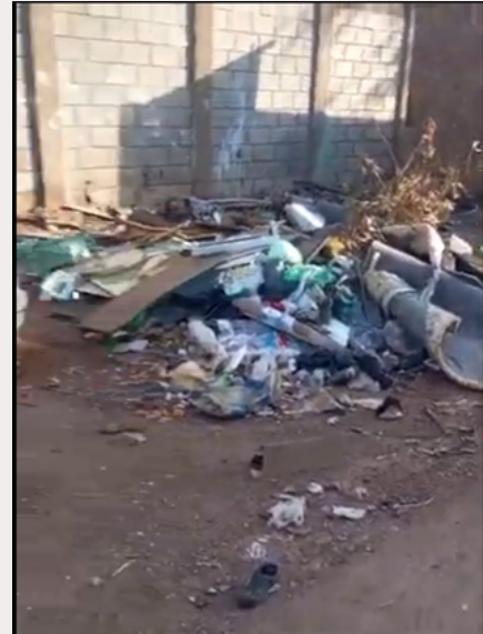
Papa-lixo 2 : Muito lixo fora do papa-lixo, vidro, resto de materiais de construção e sucata