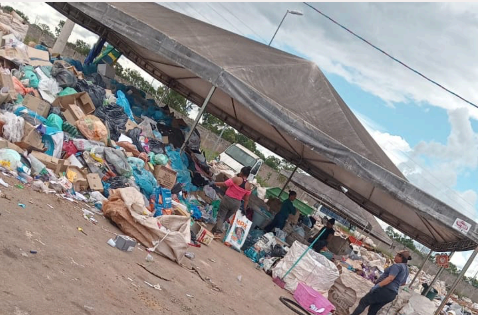
Tendas improvisadas ainda são usadas pelas cooperativas para a separação dos resíduos.

O cenário dos resíduos sólidos no Brasil vem passando por uma transformação estrutural, impulsionada por marcos legais e intervenções judiciais que têm como foco central a figura do catador de materiais recicláveis. Longe de serem meros "coletores informais", hoje esses trabalhadores são reconhecidos pela lei como agentes ambientais essenciais. A trajetória dessa mudança tem como base a Lei 12.305/2010, que instituiu a Política Nacional de Resíduos Sólidos (PNRS), um divisor de águas ao reconhecer oficialmente a profissão de catador.